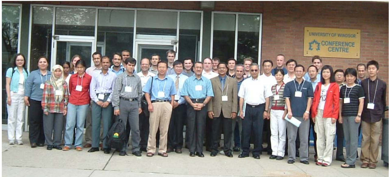
Photo showing most of the student and faculty attendees at WindSOR/SWORD 2004